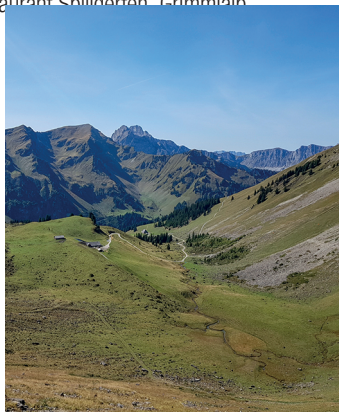
Im Abstieg ins Diemtigtal.