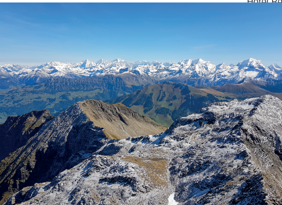
Der Blick reicht bis zu den Zentralschweizer Alpen. In der Bildmitte Eiger, Mönch und Jungfrau.

Restaurant Eggli, Grimmialp, 033 684 00 17, egglichswenden.ch Hotel Restaurant Spillgarten, Grimmialp