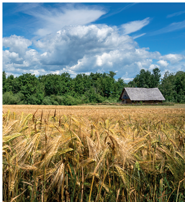
Bei Gletterens erfährt man im Pfahlbauerdorf vieles über früher.