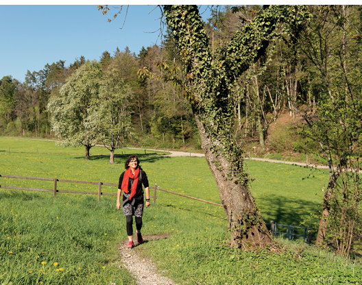
Lieblicher Wanderabschnitt bei Friedberg.

V7 Bar, oberhalb von Thundorf, 052 376 47 47, www.v7bar.ch