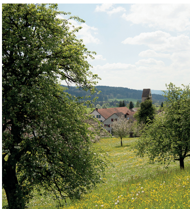
Durch die Baumkronen hindurch grüsst Lustdorf.