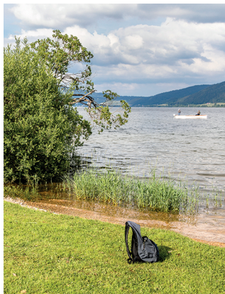
Am Ende der Wanderung wartet ein Bad im Lac de Joux.