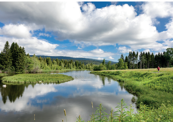
Naturidylle bei Tête du Lac.

Camping à la Ferme, 021 845 54 04 oder 021 845 48 15, www.campinglesbioux.ch Altitude 1004, 079 282 98 52 oder 078 686 20 33, www.altitude1004.ch Hôtel-Restaurant Bellevue Le Rocheray, 021 845 57 20, www.rocheray.ch