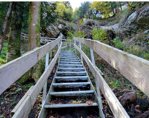
Treppen und Stege führen sicher durch tiefe Tobel in Appenzell Ausserrhodon.

Landgasthaus Rössli, 071 367 12 15, www.roessli-hundwil.ch