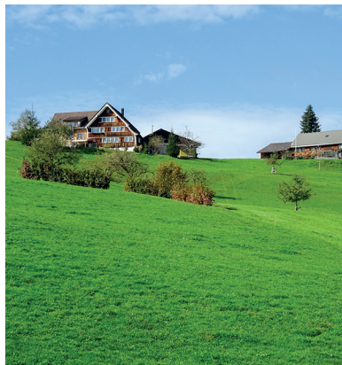
Der zweiten Teil der Wanderung führt über sanfte Hügel.