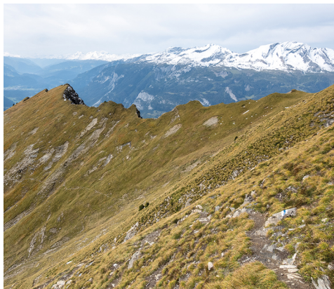
Le long de la pente abrupte qui monte au Montalin.