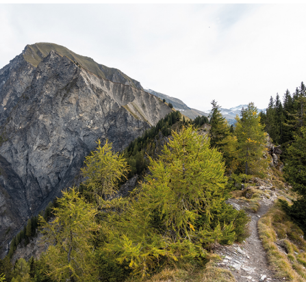
Vue du Fürhörnlï au Montalin.

Restaurant Zur alten Post, Maladers, 081 252 67