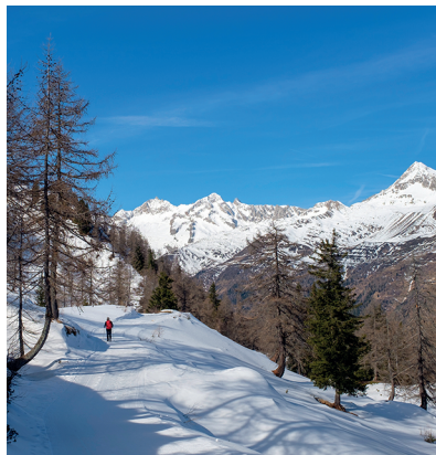
Promenade avec vue sur le Pizzo Lucendro, le Pizzo Rotondo et le Chübodenhorn.