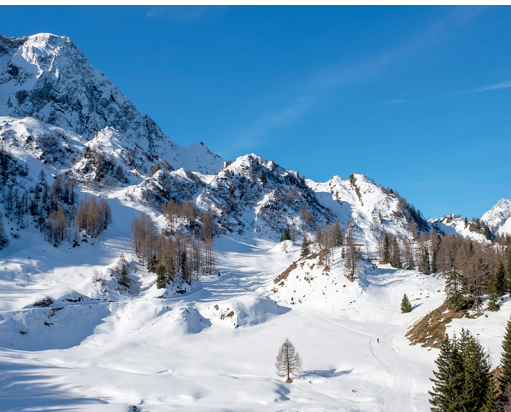
Le chemin de randonnée hivernale serpente jusqu'aux abords de Pesciüm.

091 825 60 12, www.tremola-sangottardo.ch