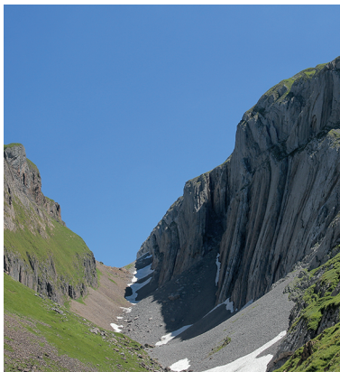
Dans le Gross Mälchtal, le chemin est bordé de parois rocheuses abruptes.