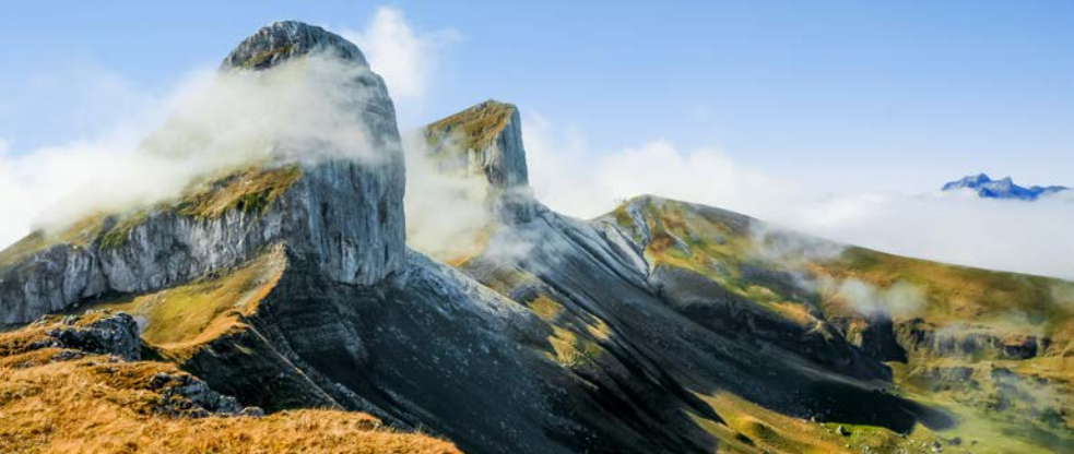
La Tour de Mayen, et celle d'Aï en arrière-plan