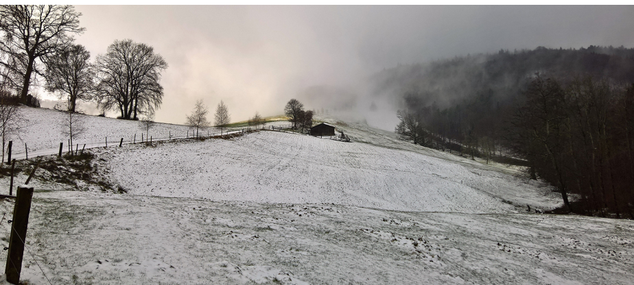
Quelques centimètres de neige, et le paysage change d'apparence.

Restaurant Weingarten, Thalheim, 056 443 12 74, www.wygaertli-thalheim.ch Auberge Thalner Bär, Thalheim, 056 443 38 88, www.thalner-baer.ch