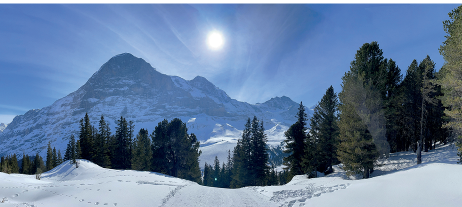
Peu avant Bustiglen, le trio se dévoile dans toute sa splendeur.

Berghaus Männlichen, 033 853 10 68, www.berghaus-maennlichen.ch Bergrestaurant Kleine Scheidegg, 033 828 76 92, www.bergrestaurant-kleine-scheidegg.ch Hôtel Kleine Scheidegg, 033 855 12 12, www.scheidegg-hotels.ch