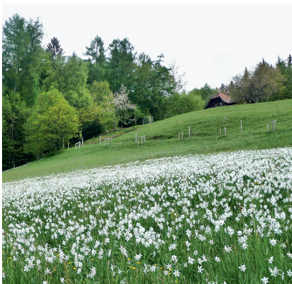
Wie Schnee im Mai: Unterhalb des Cubly blühen die Narzissen.