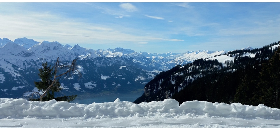
Das Panorama lässt hier nichts zu wünschen übrig.

Bergbahn und Berghaus Niederhorn, 033 841 14 20, www.niederhorn.ch