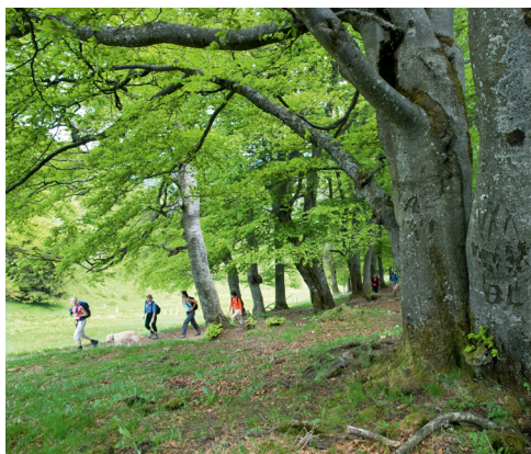
Alte Buchen auf dem Vogelberg.