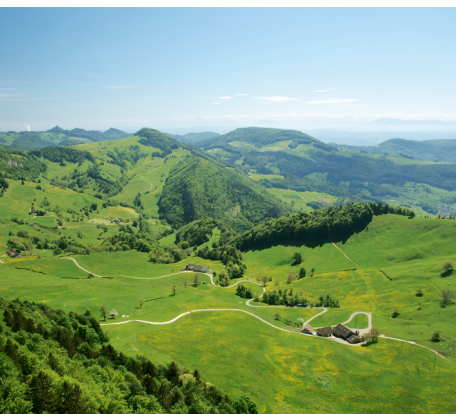
Aussicht vom Vogelberg.